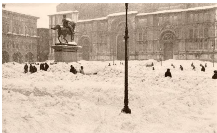
nevicata del febbraio 1929