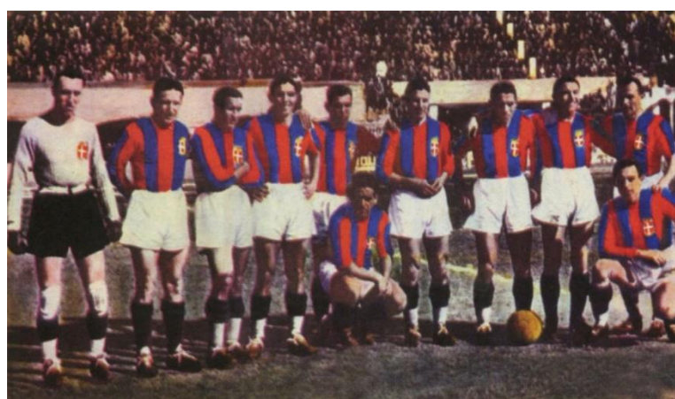
al Bologna lo scudetto del 1936