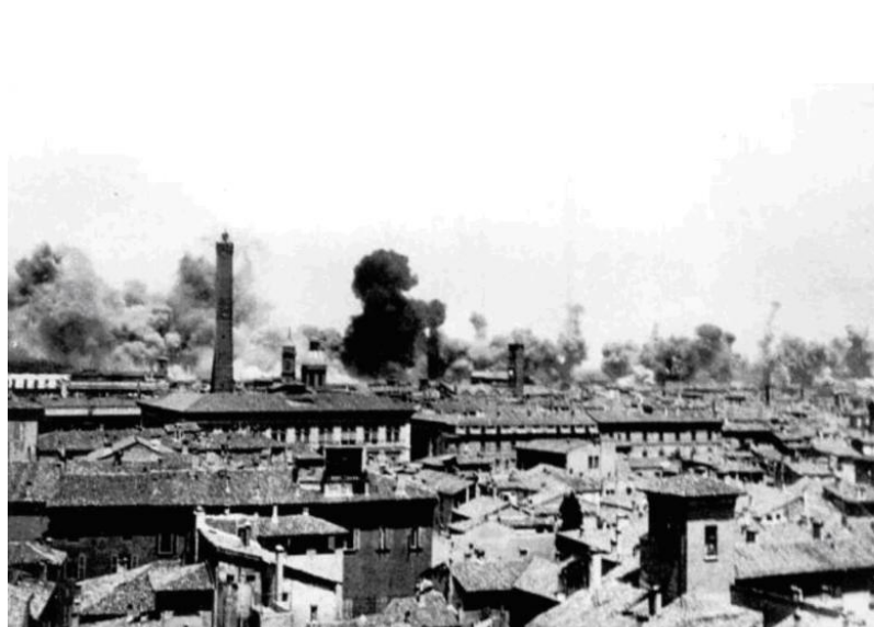
bombardamento del 15 luglio del 1943