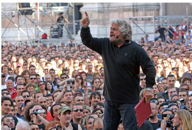
8 settembre 2007 "V Day" a Bologna con Beppe Grillo