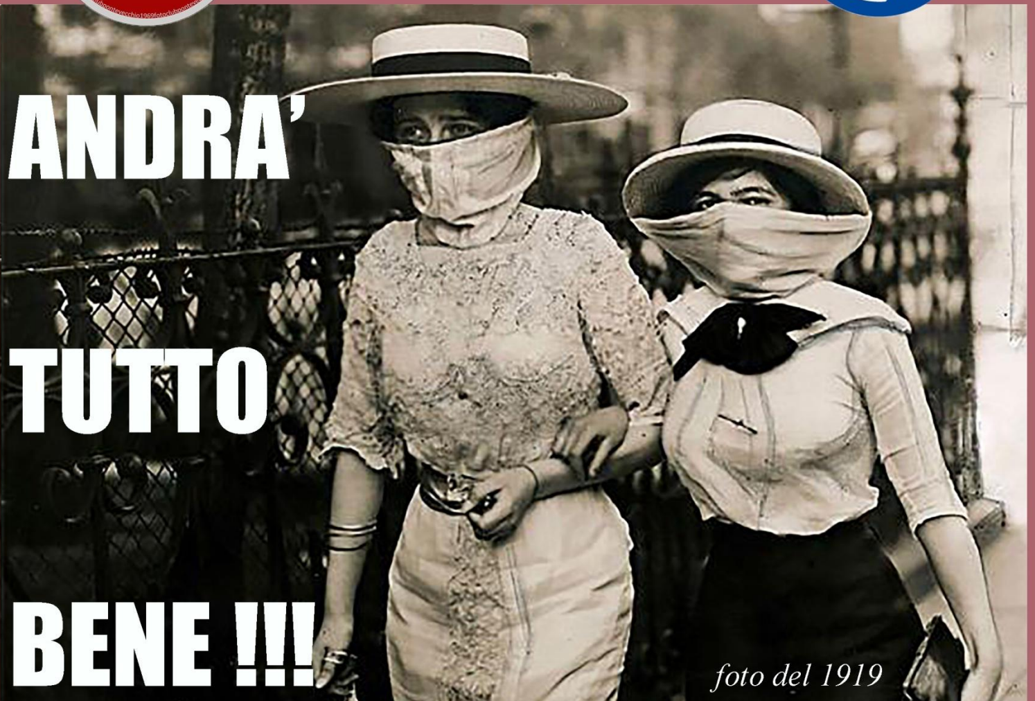
foto del 1919