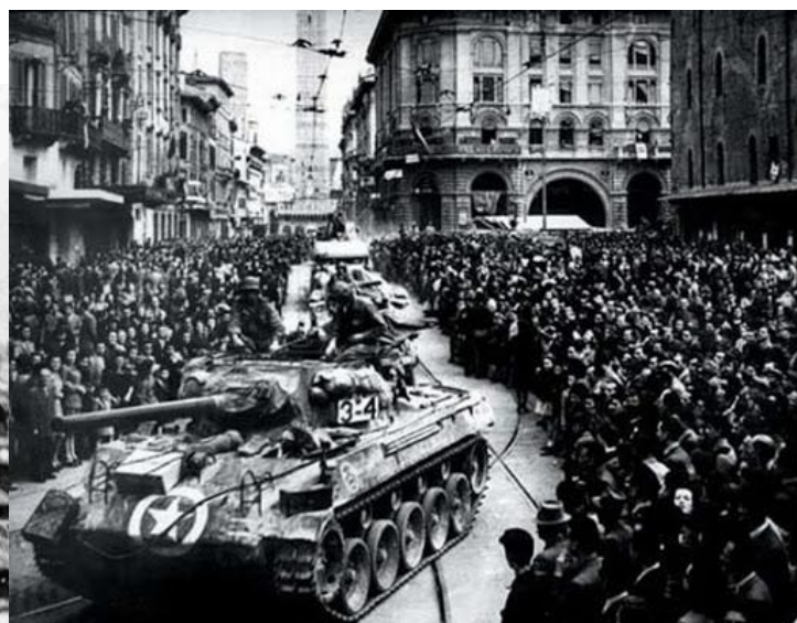
liberazione di Bologna, 21 aprile 1945