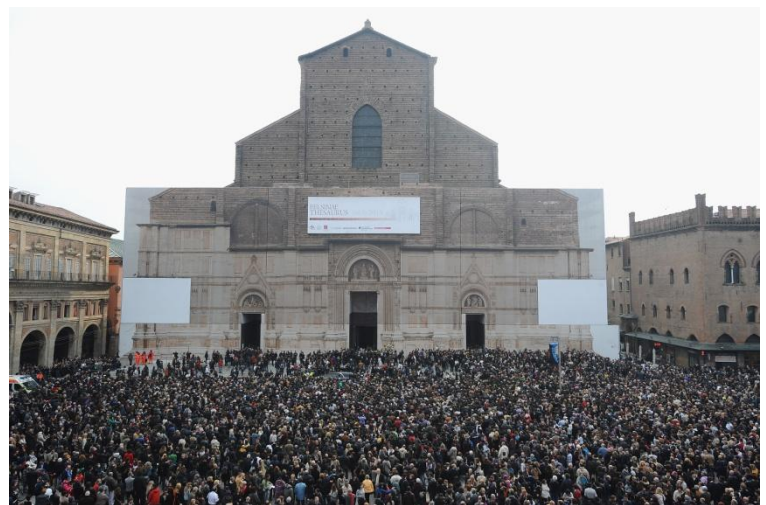
4 marzo 2012, funerale di Lucio Dalla