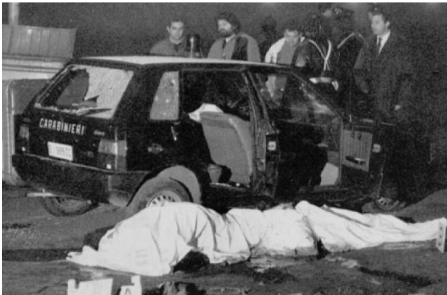
4 gennaio 1991, al Pilastrò la banda della "Uno bianca" uccide tre carabinieri