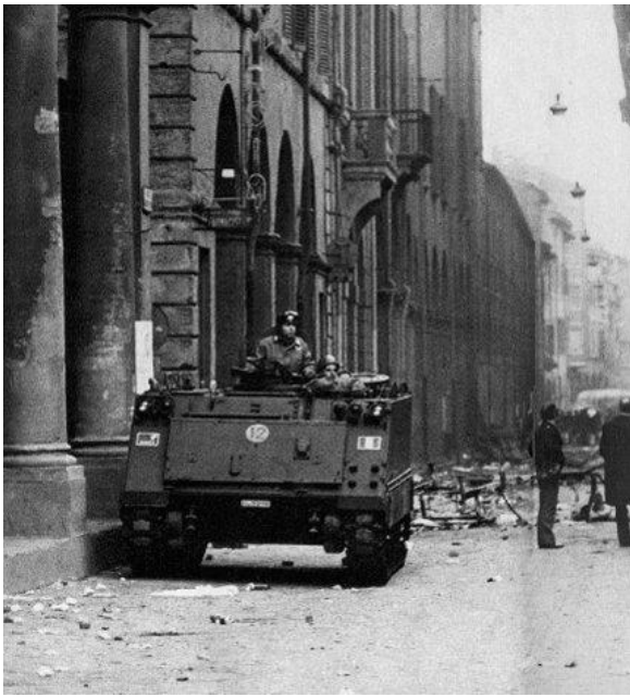
11 marzo 1977, uccisione di Francesco Lorusso