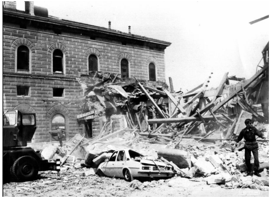
2 agosto 1980, strage alla stazione di Bologna