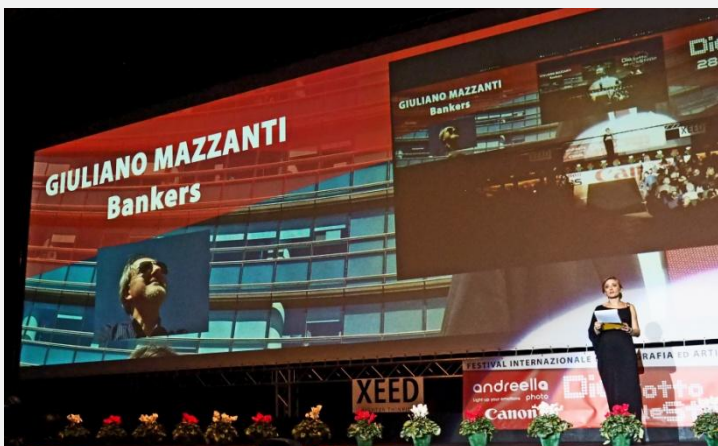
28° edizione del 2019 “Bankers”