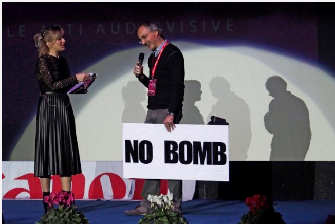
24° edizione del 2015 “Oltre il Muro”