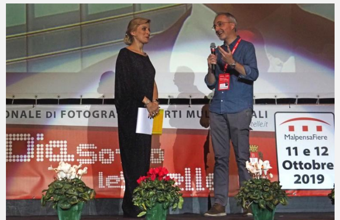
“The Human ZOO”