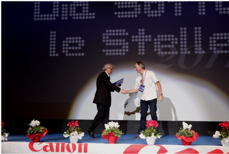
20° edizione del 2011 “Palio, la corsa dell’anima”