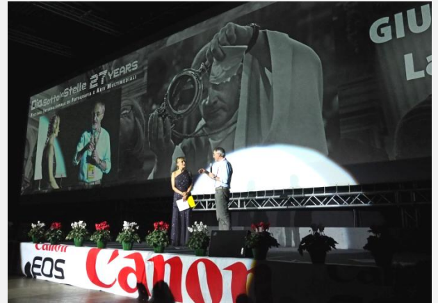
27° edizione del 2018 “Lacrime e Sangue”